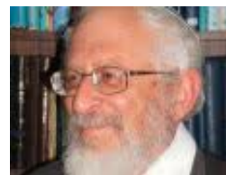
גם מי שאינו דמות מוסרית יכול לשרת את הציבור

ארגון זה (נו, טוב, אם לא שמעתם עליו כנראה שטרם הוקם...) מתכנן כנראה גם קמפיין נגד הצעת החוק שעברה לפני כחודש בכנסת ישראל, בקריאה טרומית, לפיה "כלב או חתול ללא בעלים יימסרו לאימוץ רק לאחר עיקור או סירוס". ובדברי ההסבר כתוב לאמר: "מטרת הצעת החוק היא לצמצם את מספרם של כלבים וחתולים נטושים, עזובים ומשוטטים, באמצעות עידוד ניתוח עיקור וסירוס". שוחרי הזב"ח סבורים כי זהו חוק גזעני, אנטי-הומאני וחסר-חמלה שדגל שחור מתנוסס עליו בעליל. מי שמנו לנגוס באוכלוסיית חתולי הרחוב.